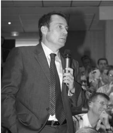
Le Contrôleur général Roche.