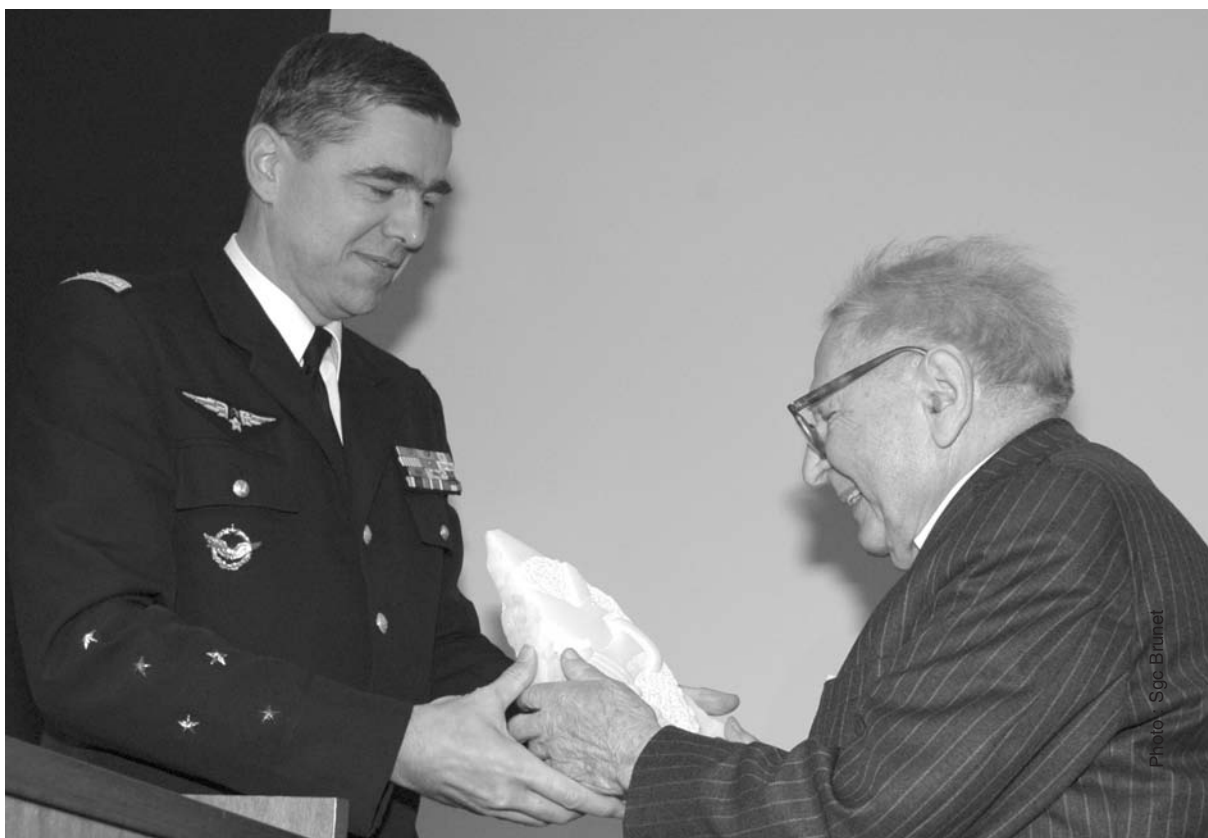
Remise d'une œuvre originale au général Pierre Gallois par le général d'armée aérienne Stéphane Abrial, chef d'état-major de l'armée de l'air.

✓ Général Gallois : Merci d'avoir eu la patience de m'écouter et vous ne pouvez pas savoir quel bonheur vous donnez au vieil homme. J'ai commencé ma vie dans l'armée de l'air et la termine tout près d'elle, c'est pour moi une merveilleuse fin de vie. Merci. ●