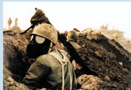
Soldat iranien durant la guerre Iran-Irak

Un quart de siècle avant les événements en Syrie, les armes chimiques ont été utilisées par l'Irak et probablement par l'Iran au cours du conflit ayant opposé les deux pays entre 1980 et 1988. Outre l'instauration du régime islamique en Iran, l'une des causes de cette guerre est liée à l'application des accords d'Alger de 1975, confirmés par le Traité de Bagdad de 1978. Ils imposaient une nouvelle délimitation des frontières dans le Chatt el-Arab, couloir d'eau douce représentant le seul accès de l'Irak à la mer, en contrepartie de l'arrêt par l'Iran des actions de subversion et du soutien aux rebelles kurdes. Les Iraniens ont unilatéralement dénoncé ces accords dès 1979. Pour justifier le déclenchement des hostilités, l'Irak a invoqué « la volonté de rétablir la souveraineté et les droits irakiens sur les territoires qui lui [appartenaient] » en vertu de ces accords, motif auquel se sont ajoutées les revendications concernant certaines îles du détroit d'Ormuz occupées par l'Iran.