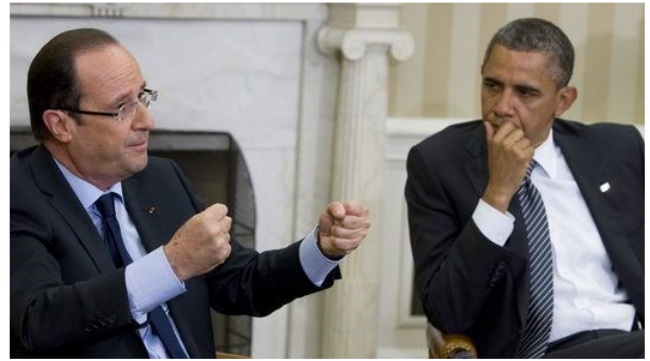
Les présidents français et américain ont été en pointe dans la dénonciation des agissements du régime syrien et, plus particulièrement, sur la question des armes chimiques.

En mars 2011, la Syrie a connu ses premières manifestations de grande ampleur. Dans le contexte général de ce qui est communément appelé dans les médias le printemps arabe, et, plus précisément, alors que les opérations militaires contre le régime du colonel Qaddafi débutaient en Libye, une partie de la population syrienne a commencé à réclamer le départ du président Bachar el-Assad. Au pouvoir depuis juillet 2000, Bachar el-Assad a succédé à son père, Hafez el-Assad, arrivé à la tête de l'Etat syrien à la faveur d'un coup d'Etat en novembre 1970. Le régime syrien a réagi avec force aux premières manifestations, sollicitant l'armée pour les réprimer. Suite à quoi le mouvement de protestation a rapidement dégénéré en conflit armé, à l'image de la révolution libyenne quelques mois auparavant.