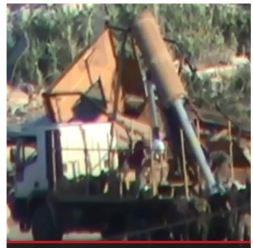
TELE (TEL) de la roquette. Des systèmes à deux rampes ont également été identifiés.