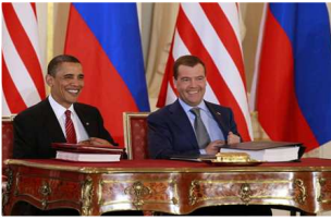
Signature du traité New START.

Le Traité New START signé entre les Etats-Unis et la Russie le 8 avril 2010 a été ratifié par le Sénat des Etats-Unis par 71 voix contre 26 mercredi 22 décembre 2010. Les 56 sénateurs démocrates, 2 sénateurs indépendants et 13 sénateurs républicains ont permis cette ratification. Ce résultat était présenté comme très hasardeux après le résultat des élections législatives de mi-mandat le 2 novembre dernier et dans le cadre de la lame-duck session . Dans la foulée, la chambre basse du Parlement russe, la Douma, a adopté vendredi 24 décembre le traité en première lecture, par 350 voix contre 58. Le texte a été