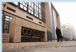
Le bâtiment du Conseil de l'UE.

http://register.consilium.europa.eu/pdf/en/10/st17/st17080.en10.pdf