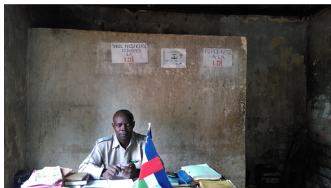
Poste de gendarmerie de Bocaranga.

Devant une vingtaine de personnes venant d'horizons divers (ministère des Armées, ministère des Affaires étrangères, chercheurs), Thierry Vircoulon, chercheur associé à l'IFRI, a fait une présentation sur la République centrafricaine et le conflit violent qui s'y déroule depuis 2012, fondée sur une vue « par le bas » qui se focalisait sur les zones périphériques et rurales à l'ouest et l'est du pays. Les réalités de ce conflit s'expriment au grand jour dans la profondeur d'un territoire abandonné par le gouvernement, exploité par les groupes armés mais encore animé par certains réseaux et organisations non étatiques, notamment dans le domaine de l'éducation, de la santé et de la justice, parfois soutenue par des ONG internationales. Méconnues par ceux qui regardent la crise centrafricaine de Bangui, ces réalités doivent être prises en compte par les initiatives de sortie de conflit.