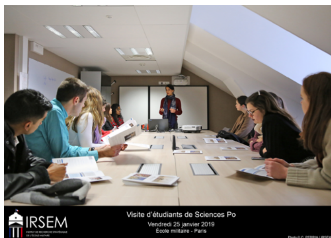
Visite d'étudiants de Sciences Po Vendredi 25 janvier 2019 Ecole militaire - Paris