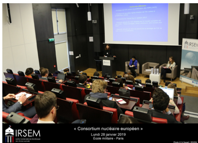
« Consortium nucléaire européen » Lundi 28 janvier 2019 Ecole militaire - Paris