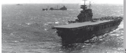
Le porte-avions USS Yorktown dans la mer de Corail en 1942

Lorsque survient cet événement singulier et inattendu, les amiraux sont convaincus que les flottes de surface sont destinées à s'affronter en fonction des critères qui ont toujours prévalu jusque-là, en faisant usage de leur artillerie et en manœuvrant. Pourtant, les 7 et 8 mai 1942, en mer de Corail, se produit le premier affrontement aéronaval de l'histoire dit « au-delà de l'horizon ». En cette occasion, les deux adversaires se battent par l'intermédiaire de leurs aviations embarquées, à plus de 160 km de distance. Les Américains y laissent un porte-avions et les Japonais un, mais un second est gravement avarié.