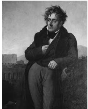
François-René, vicomte de Chateaubriand, méditant sur les ruines de Rome, Anne-Louis Girodet de Roussy-Trioson, 1811, huile sur toile, châteaux de Versailles et de Trianon.

Dans les Mémoires de ma vie , il s'attache à l'évocation de sa jeunesse et de sa personne privée. Par la suite, dans les Mémoires d'Outre-Tombe , il s'efforce de réinvestir véritablement l'Histoire et de dépasser les confidences personnelles. À l'exemple de Shakespeare, il veut représenter toute la substance de l'humanité, en exposant les scènes « basses » autant que les scènes « hautes ». Sa vie est bientôt envahie par ce « monument », doté dès lors d'une double temporalité : celle de l'action, et celle de la réflexion née de l'écriture. En tant que témoin irremplaçable de l'épopée de son temps, il renonce à une affirmation individualiste pour viser un avenir au-delà de la tombe, car il veut que la publication de ses mémoires soit posthume : selon lui, c'est hors du temps que peut parvenir aux vivants une « voix incomparable ».