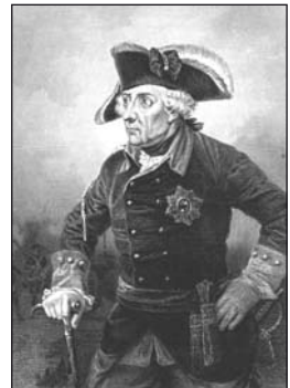
Frédéric II de Prusse

Une première particularité réside dans la postériorité du mouvement par rapport à la monarchie absolue. Le despotisme éclairé émerge surtout dans la seconde moitié du XVIII e siècle : Frédéric II de Prusse succède à son père en 1740, Catherine II de Russie monte sur le trône en 1760 et Joseph II règne seul sur le Saint-Empire romain germanique dès 1780.