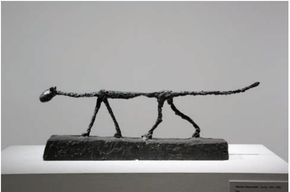
Cat , Alberto Giacometti (1901-1966), cf Les Carnets du Temps n° 55 de mars 2009.