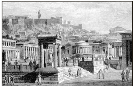
L'Agora à Athènes, lieu de débat politique de l'Assemblée du peuple

la confection des lois à une contestation ouverte entre plusieurs opinions, de manière que, par un mécanisme d'essais, d'échecs et de tris, la formulation la plus juste et la plus acceptable par le plus grand nombre finisse par émerger et par s'imposer, au moins provisoirement. En effet, les affaires humaines ne cessant de changer et d'évoluer, la législation est de nature évolutive. Le concept de la justesse des lois par la confrontation des points de vue met en évidence la distinction entre deux classes de lois. La première, celle des lois constitutionnelles , porte sur le dispositif et sur les procédures, dont doit résulter la pacification des conflits. Elles définissent les règles fondamentales du jeu politique. Elles doivent être légitimes , au sens où elles doivent être appropriées à la fin du politique et à la paix. La seconde catégorie, beaucoup plus nombreuse, recueille les lois circonstancielles , qui règlent et