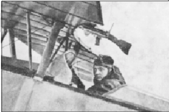
En mars 1916, Georges Guynemer à bord de son Nieuport.