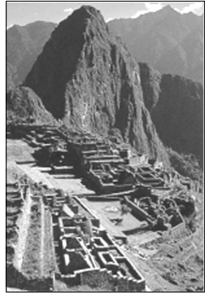
Vue d'ensemble de Machu Picchu

Le nom Inca signifie « fils du soleil » ; donné aux souverains du peuple quecha , il s'étend par la suite aux peuples amérindiens qui lui sont soumis.