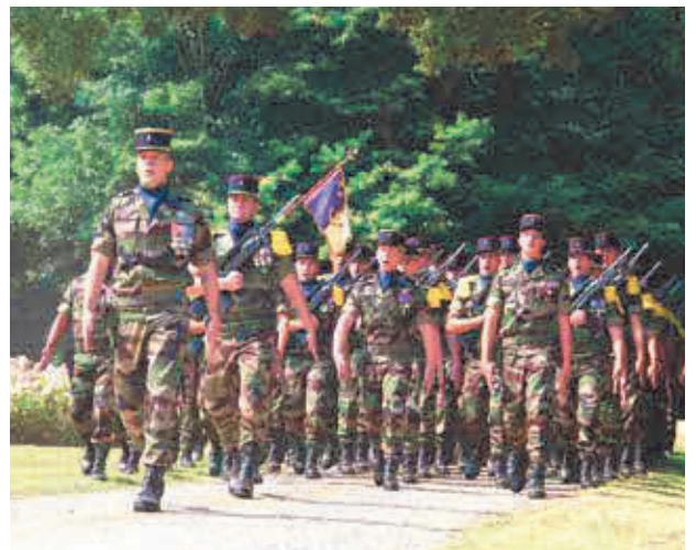
1 ère compagnie du 3 e RIMa

Dans mon cas, après avoir servi trois belles années au sein d'un régiment de Cavalerie, avec son système de fonctionnement propre, j'ai été mutée dans un régiment du Matériel. Il m'a alors fallu rapidement m'adapter aux contraintes de production, aux process bien spécifiques et à une organisation du travail et des activités assez différentes. J'ai mis à profit ma première année au sein du BMOI (14) pour comprendre comment travailler efficacement dans ce nouvel environnement. J'ai finalement appris plutôt « sur le terrain » , en m'appuyant sur les conseils avisés de CDU en deuxième année. »