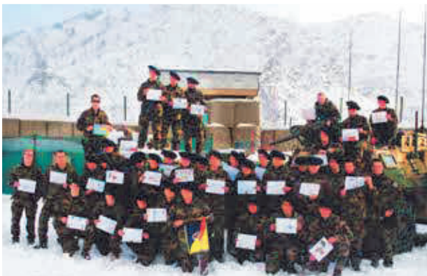
Noël en opex - 27 e BCA

« Le rapport avec la mort. Nullement préparé, encore vierge de toute incertitude et de toute peur, je l'ai vue s'abattre sur un camarade lors d'un exercice. Elle m'a marquée et, au même titre que mon état de père de famille ou de soldat, a fait de moi ce que je suis. Je continue à la croiser, de temps en temps, d'un peu plus loin. Mais elle reviendra... »