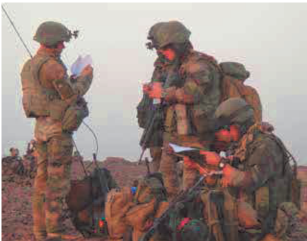
35 e RAP - Servat