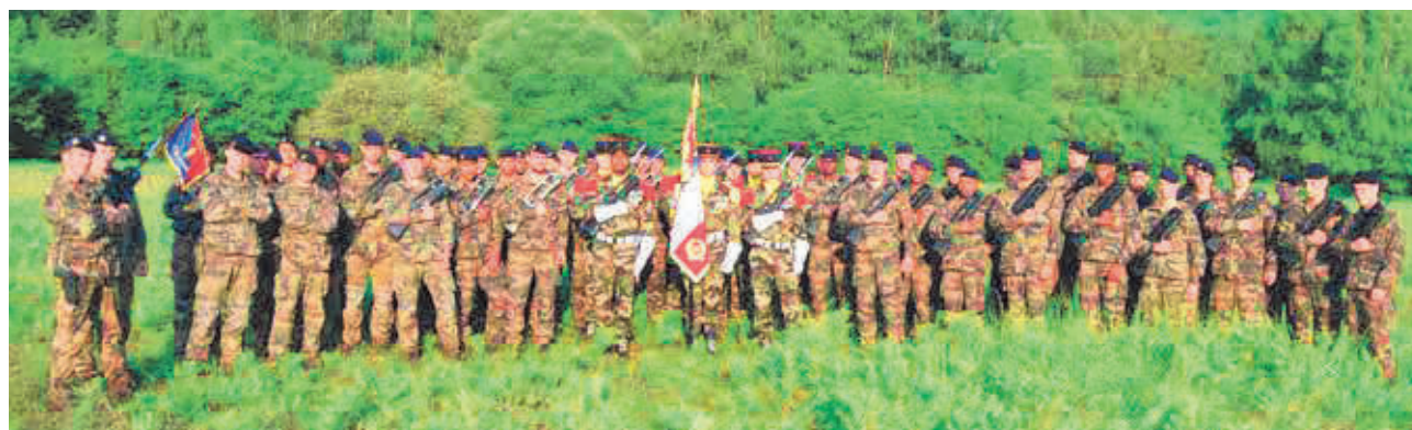
126 e RI

« Tout à fait. J'entends par là, qu'en fonction des contraintes de l'environnement et des missions qui m'ont été fixées, j'ai toujours pu procéder comme je l'entendais. J'ai même pu, lorsque cela était nécessaire, revoir les termes de ma mission. Cela tient pour une part à l'esprit des armes d'appui qui laisse une grande part d'initiative aux subordonnés. Cela tient pour une autre part à l'esprit de la 9 e BIMA (3) ; j'ai eu en effet l'occasion de mesurer lorsque j'ai été détaché auprès de chefs de corps de la brigade combien cette idée leur paraissait naturelle. »