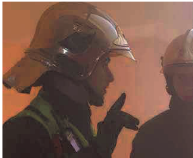
Brigade de sapeurs pompiers

« Le style est indissociable du chef. Il n'a pas à le cultiver, à le travailler ou à y réfléchir. Sa manière d'être lui est propre, elle est sa marque. Dur ou facile d'abord, ferme ou complaisant, peu importe tant qu'il respecte son naturel. Une compagnie n'est pas un public de théâtre comparant des