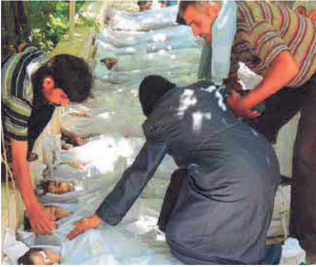
Massacre en Syrie.

surtout par la militaire qui avouera à ABC qu'elle n'était jamais tombée dans une embuscade et qu'elle n'avait jamais fait usage de son arme. En fait, Jessica Lynch avait été victime d'un accident de véhicule et transportée dans un hôpital pour y être soignée. L'opération de libération était un pur montage concocté par des experts de l'intoxication pour impressionner la communauté internationale. D'ailleurs, il n'y avait plus d'ennemis sur le site puisque les forces irakiennes avaient fui la zone quelques jours auparavant. Les seuls Irakiens présents appartenaient au personnel médical. En fin de compte, les images coup de poing qui avaient fabriqué le mythe de la guerrière aux cheveux blonds libérée par un commando de Zorro n'étaient qu'une simulation machiavélique digne des docteurs Folimage (1) d'Hollywood pour éblouir l'inconscient collectif.