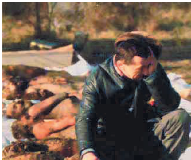
Charnier de Timisoara.

Avec l'apparition des chaînes d'information en continu et du phénomène you tube sur Internet, l'exploitation des images est devenue un enjeu capital, notamment dans la gestion des conflits. Dans ce domaine sensible, les opérations de manipulations se sont multipliées. Les manigances sont notamment légion sur le théâtre du Proche-Orient. Des spécialistes ont découvert des actions de duperies qui se traduisent par l'ajout de retouches et des mises en scène sur des photos d'agglomérations endommagées par l'aviation israélienne. Des clichés de fumée sur des quartiers sont souvent rajoutés par ordinateur pour accentuer le caractère dramatique et émouvoir l'opinion. Quant aux femmes en pleurs que l'on voit parfois devant des maisons détruites, il est bon de savoir que les propagandistes du Hezbollah font régulièrement appel à « des pleureuses de service » dont le rôle consiste à sangloter sur ordre pour leurrer et exciter les masses.