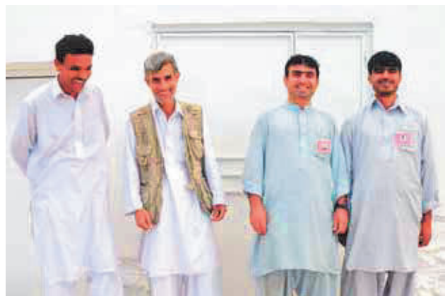
L'équipe de radio Surobi sur le perron du bunker

J'allais lui dire que ce n'était pas l'avis du bureau presse de l'armée française à Kaboul, mais il était déjà parti. Ces derniers ont reçu l'ordre, dont l'origine m'est inconnue, de ne pas communiquer sur Radio Surobi. Une consœur de la télévision qui voulait venir nous filmer en a fait les frais. Je ne sais plus à quel saint me vouer, on dirait que la hiérarchie est divisée à notre sujet. J'ai quand même pu