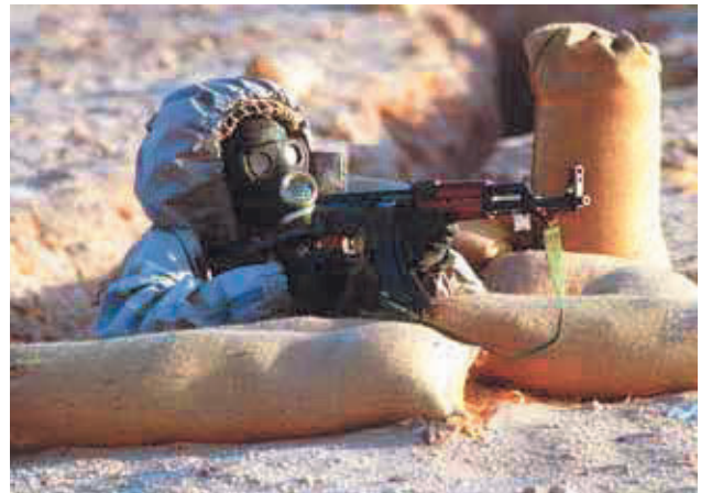
Un soldat syrien.

Prenons par exemple l'image de ce militaire français qui s'est fait prendre en photo avec un foulard imprimé d'une tête de mort. Le cliché diffusé sur la Toile a été exploité par les adversaires des unités françaises sur ce théâtre du Sahel. Les désinformateurs ont aussitôt fait référence aux guerriers du Liberia et de Sierra Leone qui, pendant les années 1990, se déguisaient de manière effrayante pour accomplir des massacres sous couvert de pratiques de sorcellerie. La manœuvre de tromperie a créé un amalgame en identifiant les soldats français aux tueurs fous qui avaient semé la terreur dans ces deux pays africains alors ravagés par la guerre civile. La réalité de ce faux vrai document est pourtant toute simple : le soldat français s'est laissé photographier pendant une pause technique par un soi-disant journaliste qui, à la recherche d'un scoop, s'est empressé de faire circuler la photo sur le Web . La « gaminerie » d'un simple combattant qui voulait tout simplement meubler son album de souvenirs a ainsi été transformée en un scandale par une manœuvre pernicieuse destinée à déshonorer l'armée française, donc à affaiblir son moral.