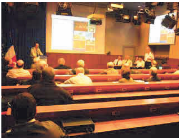
Point presse de la défense, chaque jeudi.

Car la communication est une excellente école pour s'approprier tous les aspects de notre outil de défense. Lorsque je rentre chaque jeudi dans la salle où nous tenons le point de presse hebdomadaire du ministère, je ne sais jamais quelle question va m'être posée. Or, ma conception de mon métier et l'image que je souhaite donner de ma fonction, m'imposent d'être capable de répondre sur tout le spectre de responsabilités du ministère. Une réforme de la fonction communication est en cours, avec l'approbation du ministre ; il ne s'agit nullement de faire disparaître les communications d'armée indispensables compte tenu de leurs spécificités, mais certaines capacités seront mutualisées sous la responsabilité du DICOd auquel le ministre a confié une autorité fonctionnelle sur la communication de l'ensemble du ministère. La DICOd est mixte avec des militaires et des civils. Quelle en est la plus-value ? Cet amalgame nous permet une « perfusion croisée des cultures » ! Par ailleurs, la DICOd doit incarner les armées mais aussi le SGA et la DGA. Les jeunes civils que nous recrutons nous apportent également une expertise et une connaissance des techniques les plus avancées en termes de communication.