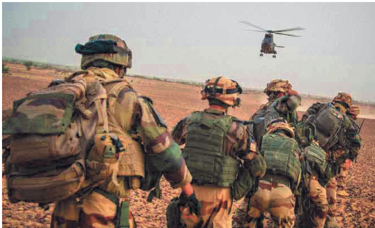
EMA-Armée de Terre/Opération Serval