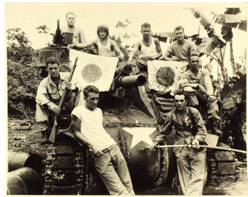
Une équipe de Combat Interview documente les combats de Saipan en 1944

À partir du mois de décembre 1943, le département de la Guerre décide d'élargir l'expérience et les méthodes développées par le général Marshall aux autres théâtres d'opérations. L'Historical Branch G2 s'associe avec le service de relations publiques du ministère pour regrouper les moyens projetables, donnant naissance à une nouvelle structure : Information & Historical Service (I&HS). L'organisation est simple. Des équipes d'historiens, composées de deux officiers subalternes et de deux sous-officiers, sont créées au niveau de la division. Leur mission est de collecter le plus largement possible l'ensemble de la documentation disponible (témoignages, tactique...), puis de la transmettre à la cellule I&HS insérée au niveau du théâtre d'opération afin que les historiens puissent réaliser une première synthèse et un récit. Envoyé à l'Historical Branch G2 de Washington, il est ensuite finalisé avant publication. À la fin de la guerre, l'Historical Branch G2 supervise l'activité de neuf unités I&HS, de