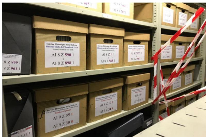
Service historique de la Défense, rayonnage sous-série AI 82 (© Olivier Valat / SHD).

Les fonds détenus par le ministère des Armées sont extrêmement hétérogènes et interrogent sur les conditions possibles de leur exploitation dans le cadre de travaux scientifiques. Les archives orales – tout comme le champ historiographique de l'histoire orale et son utilisation dans le domaine des études de la guerre – peinent encore à accéder à une forme de pleine et entière légitimité en France malgré cinquante années d'acclimatation. En dépit de quelques actions pionnières, les collectes de témoignages oraux sont encore trop souvent consacrées à la haute hiérarchie administrative ou militaire, sans rendre compte de la richesse et de la diversité des expériences combattantes.