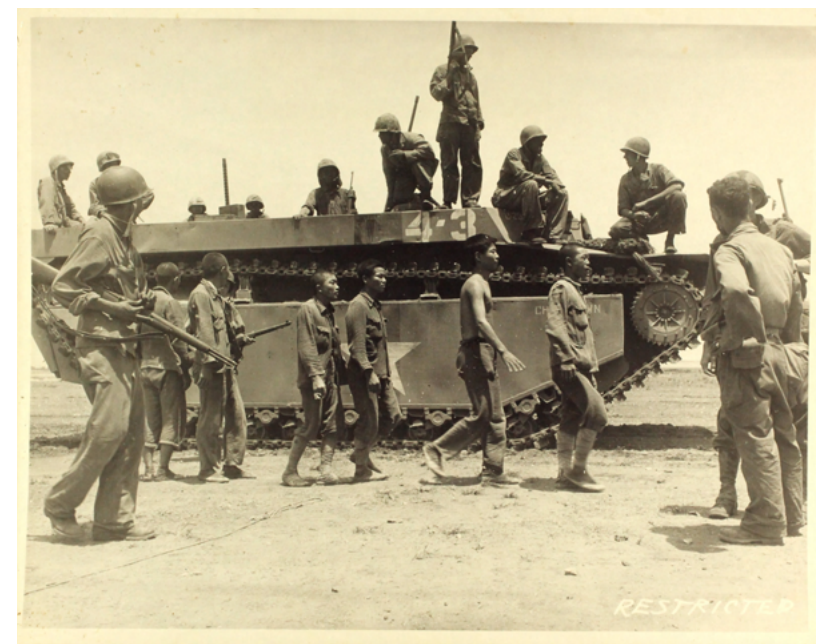
Une équipe de Combat Interview suit les combats de Saipan en 1944