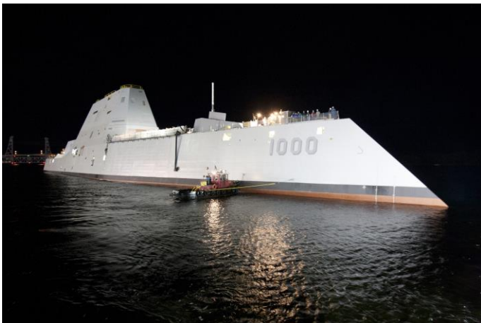
Lance-Missiles de classe Zumwalt