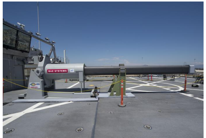
Prototype de canon électromagnétique Railgun