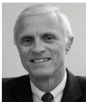
Bernard Boucault Directeur de l'École nationale d'administration

hypothético-déductive. C'est l'occasion de les sensibiliser à la nécessité de « penser par analogie » en confrontant différents paradigmes. En initiant ce partenariat, l'École de guerre, a voulu contribuer à la construction d'une France qui gagne, par un travail collectif des élèves de trois écoles prestigieuses sur des problématiques intéressant l'avenir du pays.