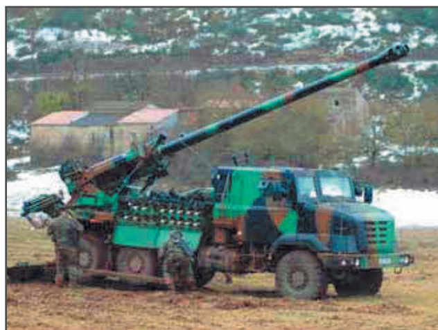
Préparation opérationnelle à Canjuers