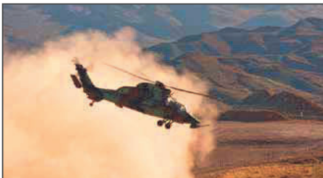
Le Tigre en Afghanistan

L'armée de Terre est actuellement dans la troisième phase de complet renouvellement de ses équipements depuis la fin de la Seconde Guerre mondiale. Elle s'attache à déployer d'emblée ses nouveaux matériels en opérations et poursuit ses efforts pour adapter les anciennes générations aux exigences des engagements actuels. Le Tigre est par exemple employé en Afghanistan depuis 2009, alors que le véhicule blindé de combat de l'infanterie (VBCI) et le camion équipé d'un système d'artillerie (CAESAR) sont mis en oeuvre en Afghanistan et au Liban. Le matériel fantassin à équipement léger intégré doit être déployé en Afghanistan à la fin de l'année. Les premières livraisons de l'hélicoptère de manoeuvre NH90 sont prévues fin 2011 tout comme celles du véhicule haute mobilité (VHM). En outre, l'armée de Terre a prévu pour 2011 d'engager 62 M€ de crédits en urgence opérationnelle en réponse aux besoins des théâtres d'opération. Enfin une grande partie des équipements actuels, sur-employés, vieillissants ou récents, requiert un effort important de maintien en condition (MCO). Dans un contexte de contraintes budgétaires fortes, la maîtrise de ce MCO constitue un enjeu majeur. Les nouvelles structures du soutien doivent y répondre.