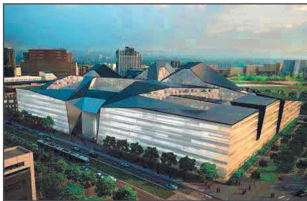
Projet Balard, le Pentagone à la Française

Enfin l'année 2011 est celle du lancement de la réorganisation du niveau central avec la signature le 11 mai du partenariat public-privé du projet commandement des armées Balard. La modification de la chaîne de commandement territoriale s'est accompagnée d'une reconfiguration de l'empreinte territoriale.