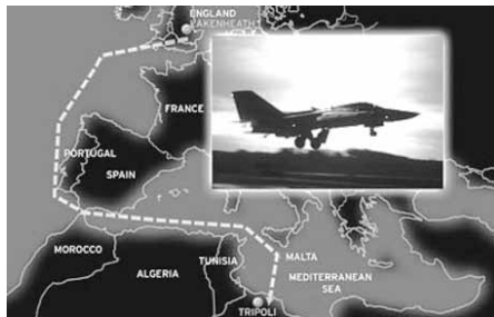
Un bombardier stratégique F-111F de la 48 th Tactical Fighter Wing décolle pour prendre part au bombardement de la Libye.

Le commandement de l'opération est donné à l'amiral Frank Kelso commandant la VI e flotte. Cinq objectifs en rapport avec les activités terroristes de l'État libyen sont définis : deux à Benghazi (un camp d'entraînement et un aéroport militaire) et trois à Tripoli (une base navale, un aéroport militaire et un ensemble de bâtiments abritant le commandement des renseignements libyens mais aussi une des résidences de Kadhafi). Pour le bombardement des objectifs ponctuels à Tripoli, il est décidé de faire appel aux F-111F de l' Air Force stationnés en Grande-Bretagne qui disposent d'une caméra infrarouge et d'un désignateur laser les rendant capables d'effectuer la mission avec précision. Mais ce recours à des avions basés à plusieurs milliers de kilomètres de l'objectif et la nécessité de mener des raids simultanés pour ménager l'effet de surprise compliquent sensiblement l'opération. La difficulté s'accroît encore lorsque la France et l'Espagne refusent d'accorder