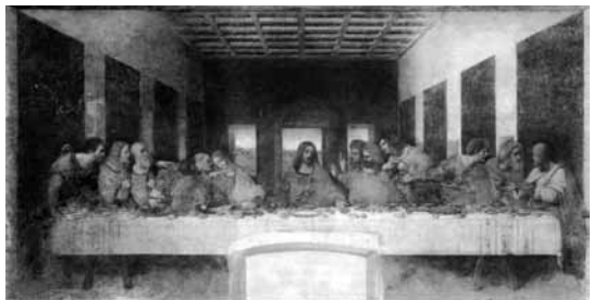
La Cène (1495-1497), Léonard de Vinci.

Léonard de Vinci (1452-1519), l'aîné d'entre eux, est un homme de science autant qu'un artiste. Très vite, il s'attelle à réaliser un certain nombre d'expériences d'ordre esthétique et technique, qu'il replace ensuite dans son art. En peinture, il substitue la modulation chro-